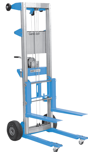
(1) Solo en recambios